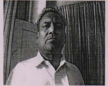
उप / सयुक्त पंजीयन अधिकारी